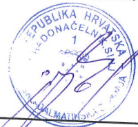
Miro Bulj Gradonačelnik